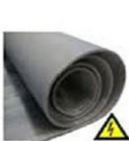
Isoliermatte: CEI 61111 - Klasse 0