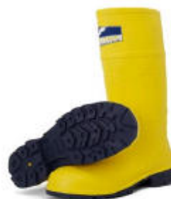
Schuhe mit isolierten Sohlen