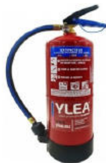
F500-Feuerlöscher für Lithium-Ionen-Batterien