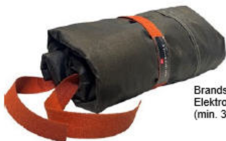
Brandschutzdecke für Elektrofahrzeuge (min. 3x3 m)